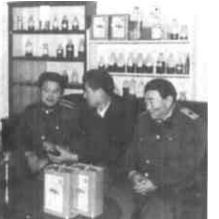
图为市工商局领导在私营企业走访调研。

在全社会设立举报电话48部、举报箱74个，从各级人大、政协、企业、工商商户中聘请了监督员，有效地防止了不正之风的发生。垦利工商分局为了深化行风廉政建设，公开在社会上聘请了120名逆向监督员，定期开会碰头，让监督员对工商局评头品足。 行业精神文明建设的深化加强，有力地促进了市工商局的各项工作。企业的登记管理、市场的培育发展，个体私营经济的指导和外资企业及市场经济秩序的监督管理等每一项工作，都跃上了新的台阶。目前，黄河口商贸城的招商力度大，进展顺利。东城农贸市场集中清理整顿后，面貌一新。河口区驻地市场、仙河镇市场、垦利贸易市场都进行了改造、完善，使全市的市场规模又向前迈了一大步。